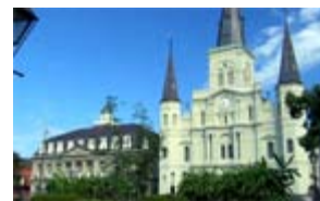
Camino a Nueva Orleans en 2012