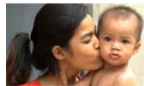
The Eliminate Project