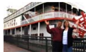
Nueva Orleans - Únase a nosotros