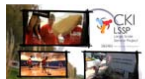
Premio Telly 2010 y Premio 2011 a

Los Premios Telly recientemente premiaron tres videos Kiwanis: