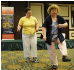
タレント・ショーでダンスステップを披露する参加者

オーストラリア アデレード市近隣に住む老人や障害者は、キワニス・バス (The Kiwanis Bus) を利用して郊外に出かけています。