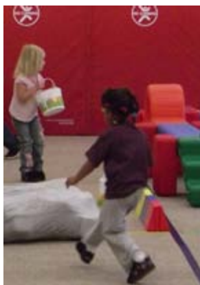
イースター・エッグや宝物を探す子どもたち