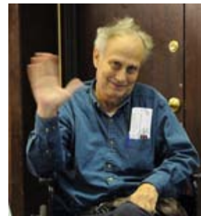
閉会式に出席するアクション・クラブのメンバー