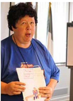
ポスター・ワークショップで自身の作品について説明するアクション・クラブのメンバー