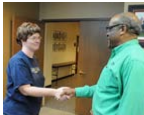
シルベスタ・ニール国際キワニス会長とアクション・クラブのメンバー

アクション・クラブ は、障害を持つ成人のためにある唯一の奉仕クラブで、世界に9千人以上の会員を有します。