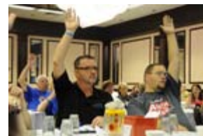
閉会式でのアクティビティに参加するキワニスとアクション・クラブのメンバー

アクション・クラブのフリッカー (Flickr) のサイトでもっと 会議の写真 をご覧ください。