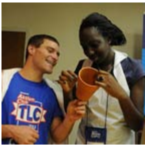
エリミネイト・プロジェクト奉仕活動にて共に活動しているアクション・クラブと国際サークルKのメンバー

エリミネイト・プロジェクトをメインテーマに行われたこの会議では、アイランド・ダンスが披露されたほか、タレント発掘ショーやモチベーションが上がるような講演なども行われました。